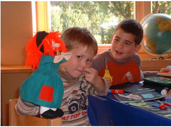
Die Hexe Susi ist als Identifikationsfigur immer dabei. Später bringt sie noch ihre Freunde, den Raben Kunibert sowie den Kater Niko mit.

Die Hexe Susi hat den dringenden Wunsch, Lesen zu lernen, da sie endlich wie eine vollwertige Hexe hexen können will. Dazu muss sie allerdings die Zaubersprüche im Hexenbuch auch lesen können. Sie erhält von ihrer Oma immer wieder hilfreiche Tipps und Spielideen, was sie als nächstes trainieren soll, um letztendlich zu ihrem Ziel zu kommen.