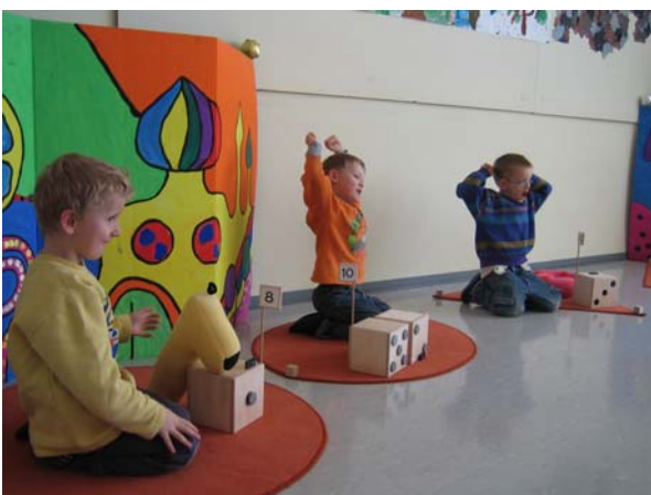
Die Aufgabe der Kinder besteht darin, den „Unsinn“ des Zahlenkoboldes zu korrigieren und die Zahlenordnung wieder herzustellen.