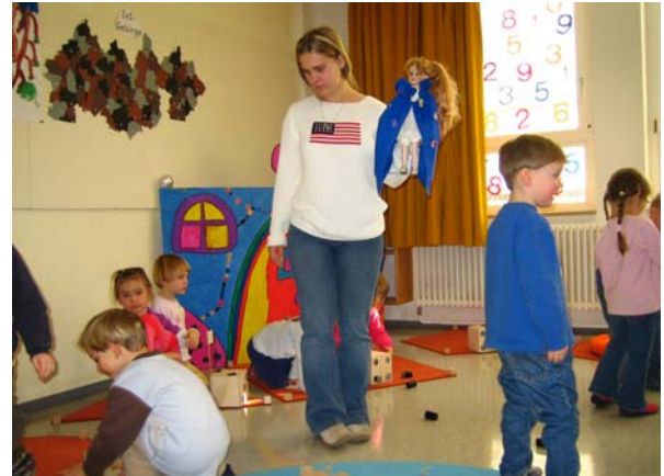
Die Zahlenfee „Vergissmeinnicht“ ist die Gegenspielerin von „Kuddelmuddel“ und kann mittels eines Zauberspruchs herbeigerufen werden. (Sie dient auch dazu verschiedene Rechenspiele und Aktivitäten anzuleiten.)