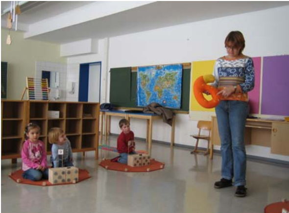
Hier tritt die „Zahl der Woche“ als Zahlenpuppe auf. Sie ist in ihrer Form den einzelnen Ziffern nachempfunden und trägt markante Merkmale in entsprechender Anzahl, z.B. die Sechs hat sechs Punkte.