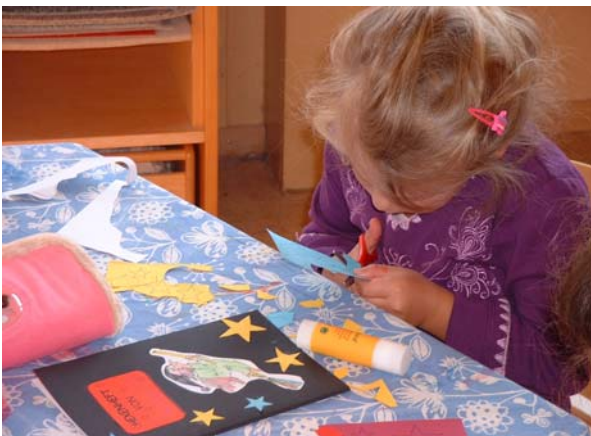
Das Hexenheft ist ein besonderer Schatz der Kinder. Entsprechend liebevoll gestalten sie auch dessen Einband.

Die Hexe Susi hat den dringenden Wunsch, Lesen zu lernen, da sie endlich wie eine vollwertige Hexe hexen können will. Dazu muss sie allerdings die Zaubersprüche im Hexenbuch auch lesen können. Sie erhält von ihrer Oma immer wieder hilfreiche Tipps und Spielideen, was sie als nächstes trainieren soll, um letztendlich zu ihrem Ziel zu kommen.