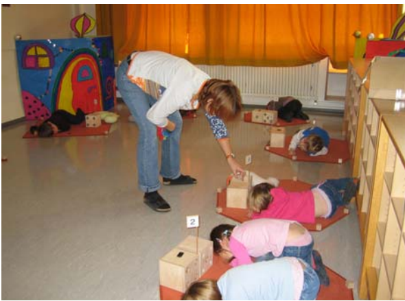
Verschiedene Zahlenspiele und Aktivitäten folgen: Während die „Zahlen“ schlafen bringt der Zahlenkobold „Kuddelmuddel“ die Ordnung der Zahlen durcheinander. Er stellt die Zahlenhäuser falsch, vertauscht Hausnummern oder macht sonstigen Unsinn in den Zahlengärten.